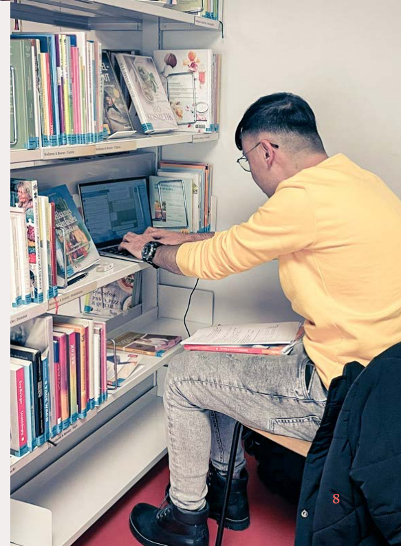
Arbeiten ohne Tisch