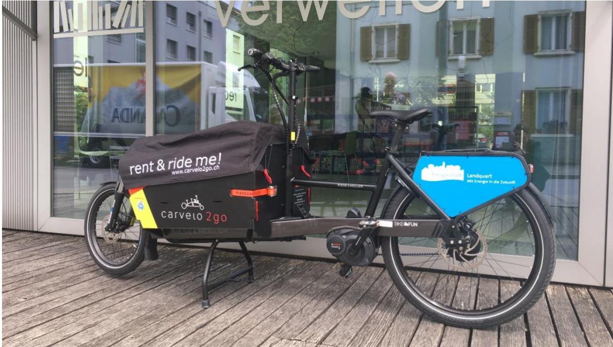
Das Cargobike betriebsbereit vor der Bibliothek

Seit Juni 2020 steht beim Bibliothekseingang ein elektrisches Cargobike zur Verfügung. Damit können Wocheneinkäufe und Pakete transportiert werden, für Kinder sind zwei Sitze mit Gurten vorhanden. Die Cargobikes entlasten die Umwelt, fördern die Bewegung und machen einfach Spass. Die Bibliothek Landquart ist die Abholstation, sie überreicht den Schlüssel und die aufgeladene Batterie.