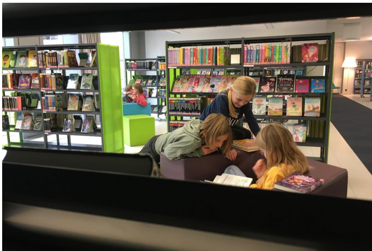
Mädchen diskutieren ihren Lesestoff

Die Bibliothek Landquart betreibt seit Jahren eine Bücherbox bei einer Bank beim Spielplatz Plantahof in Landquart. Die Box enthält Bilderbücher und lädt Besucherinnen und Besucher ein, den Kindern eine Geschichte zu erzählen.