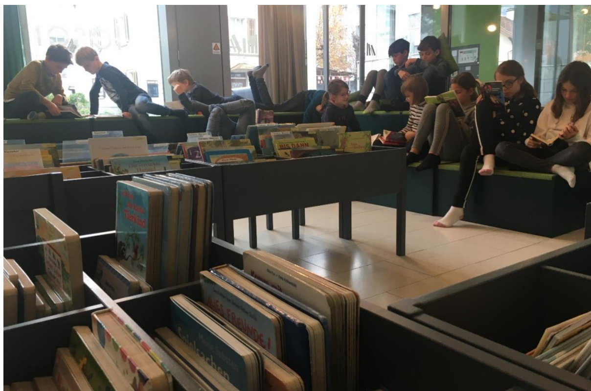
Schülerinnen und Schüler stöbern in ihren Büchern

*Anmerkung: Seit 2019 ist die Bibliothek eigenständiges Mitglied von dibiost.ch und erhält effektive Nutzungszahlen. Von 2016 – 2018 wurden Nutzungszahlen des Pools der Bündner Bibliotheken zugeteilt.