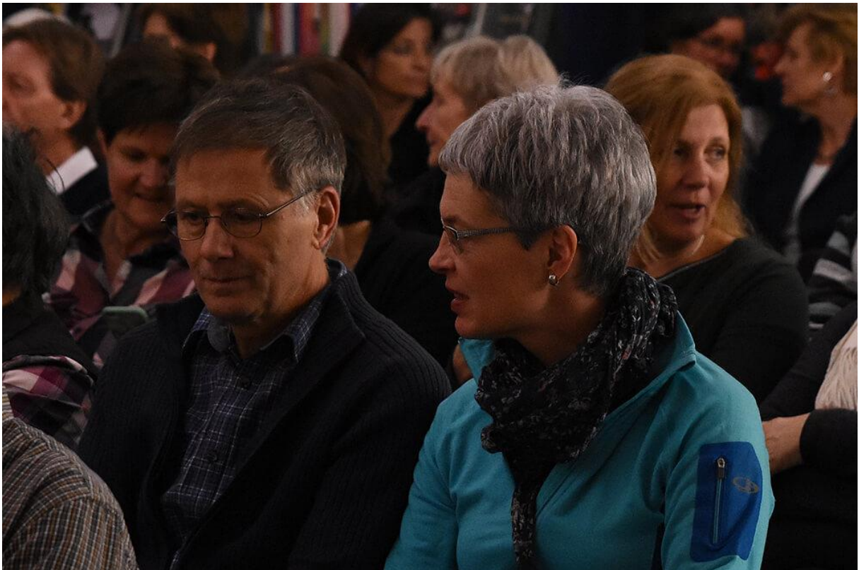
Blick ins Publikum