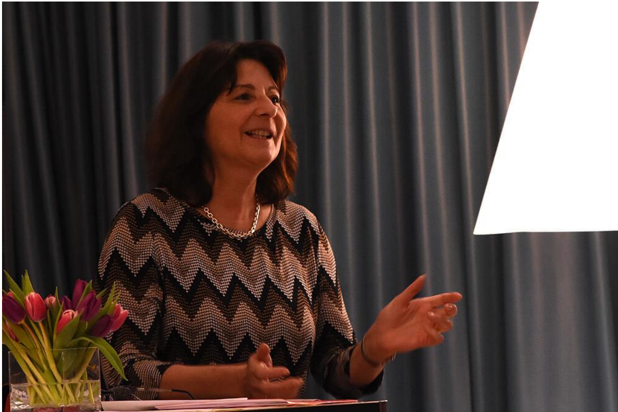
Bergell, Bergsturz & Bundesbern