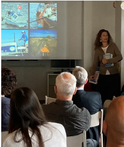
Biblioweekend vom 26.03.2023