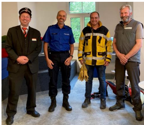
Schweizer Vorlesestag vom 24.05.2023