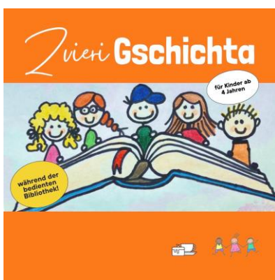
Neues Angebot ab 27.09.2023