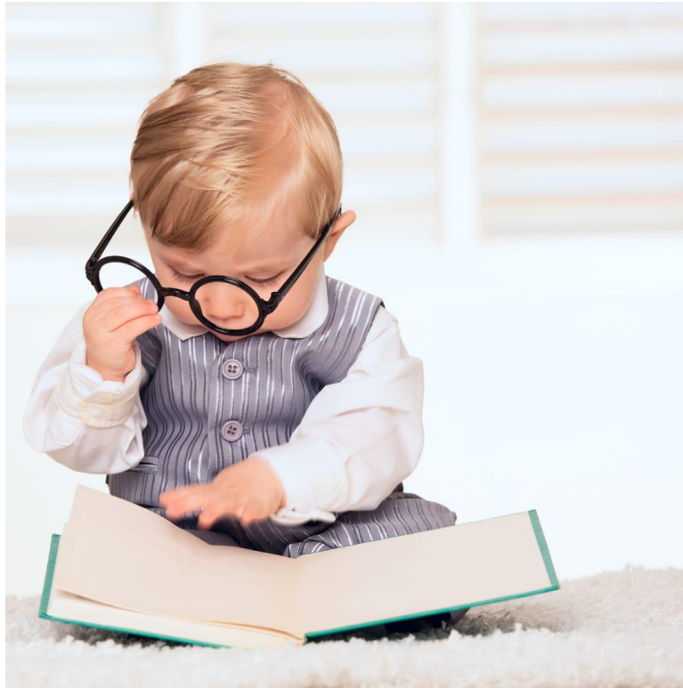
Herbst-Tagung Lesen.GR Theres Schlienger, Bibliothek Buchs SG

Leseförderung umfasst alle Massnahmen und Initiativen, die darauf abzielen, die Lesefähigkeit und Freude am Lesen zu steigern.