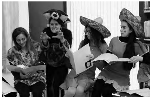
Incontro di lettura animata e musica con i Pueri Cantores

Per ulteriori informazioni visitate il nostro sito: www.biblioludoteca.ch . Pierluigi Cramerì