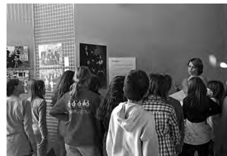
Classe in visita alla mostra fotografica Volti di famiglia

In autunno è stata allestita in biblio.ludo.teca una mostra di fotografie. L'Archivio fotografico Valposchiavo si è presentato con un scorcio sul passato della società valligiana. Circa 60 vecchie fotografie di famiglie della Valposchiavo, affiancate da altre 120 raccolte in due album dedicati alle famiglie e ai matrimoni, hanno dato un volto alla popolazione della valle fra il 1880 e il 1960.