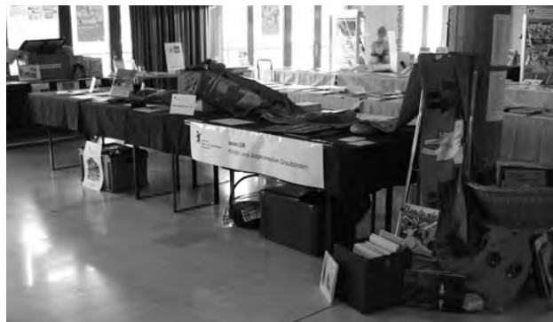
Rasulaunas cun cudeschs: Exposiziun da meds d'instrucziun Bücherraupen: Lehrmittelausstellung

Cun l'acziun comunabla «Sutga en biblioteca» che