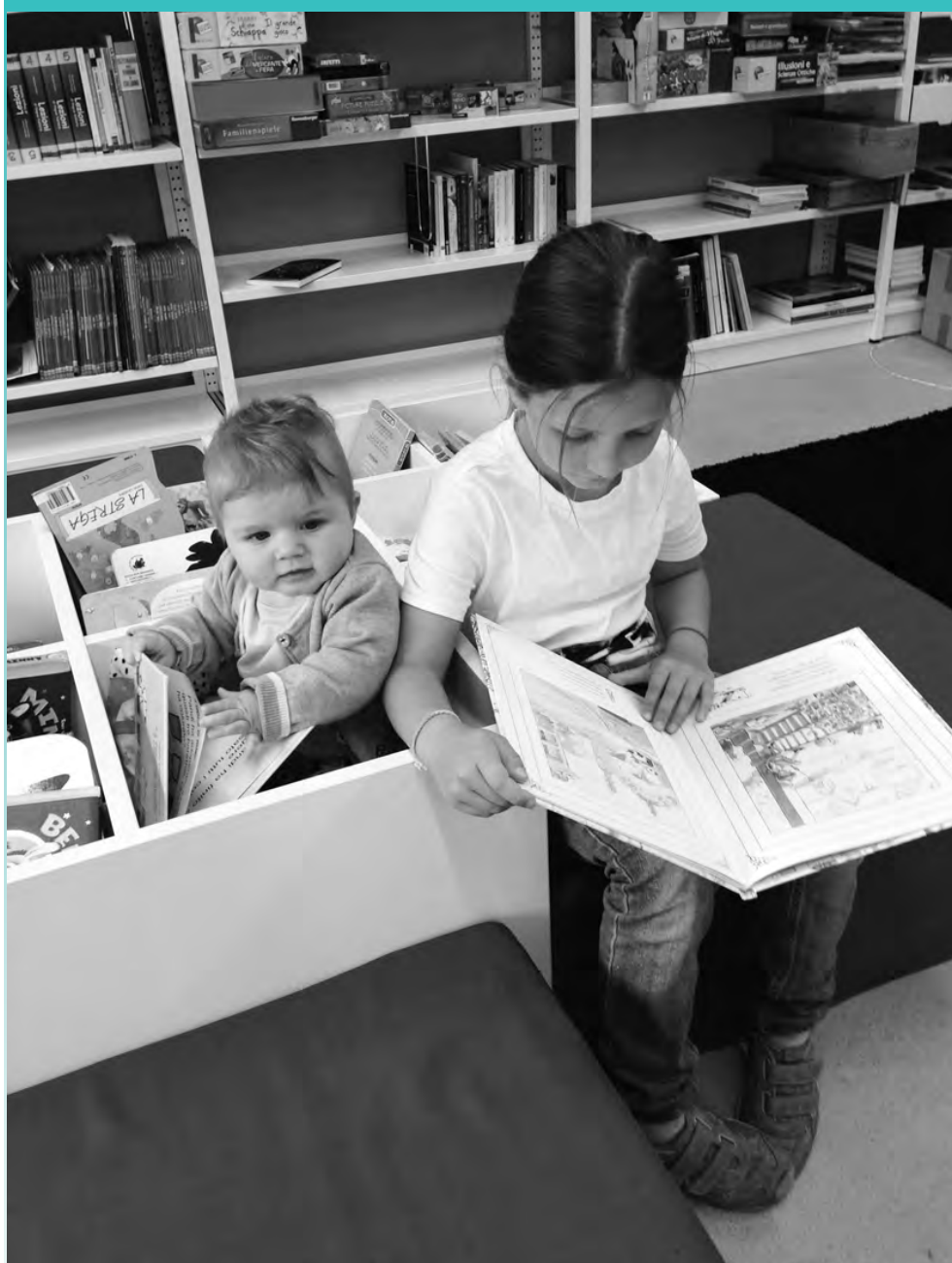
Leseförderung in der Biblioteca Grono ( ▶ Bericht Seite 22)

lesen.GR – Kinder- und Jugendmedien Graubünden leggere.GR – Media e Ragazzi Grigioni leger.GR – Giuventetgna e medias Grischun