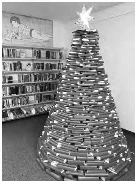
886 Bücher und 2 m hoch: Der Bücher-Weihnachtsbaum

Im April erzählte Iso Camartin einem interessierten Publikum Geschichten über das