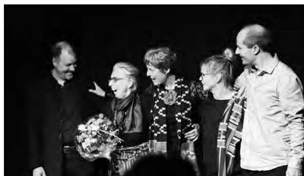
... begleitet vom A-Capella-Quartett Jazz'n'so

Um die 500 Personen besuchten unsere Veranstaltungen: 8. Mai Filmvorführung Mon-sieur Claude & seine Töchter