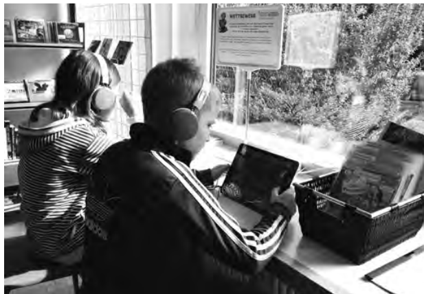
Das selber erstellte Hörbuch hören ...