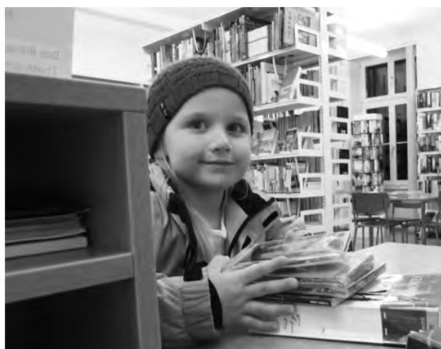
Auch Mami bekommt ein Buch