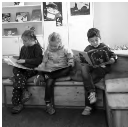
Tschlin - Uffants han scuvert cudeschs novs

Davo las vacanzas da stà vain no bibliotecaras propuonü a las magistras da la scoula primara da Valsot dad organisar per las scholaras ed ils scolars il program dad Antolin. Cun grond plaschair han ils uffants cumanzà a lavurar in classa e da profitar da quista sporta. Eir privat dumondan vi e plü uffants per cudeschs chi chattessan sül program dad Antolin. Gugent piglain no incunter giavüschi dals uffants ed eir da las magistras per spordscher üna buna schelta.