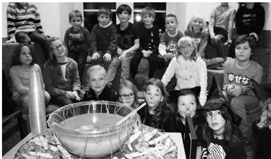
Hexennacht in der Bibliothek