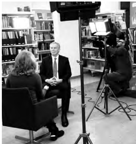
Tony Blair beim Interview in der Mediathek SAMD